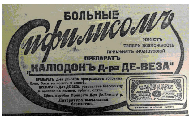
Фото 1. Плакат по лечению сифилиса, 1916 г.

Характер советских плакатов изменялся по мере исторического развития. Пропаганда, которая в них содержалась, сочеталась с общественными ценно-