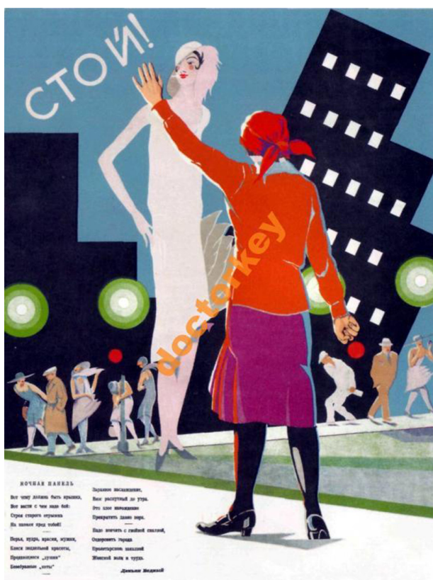
Фото 2. «Стой! Ночная панель», 1929 г.