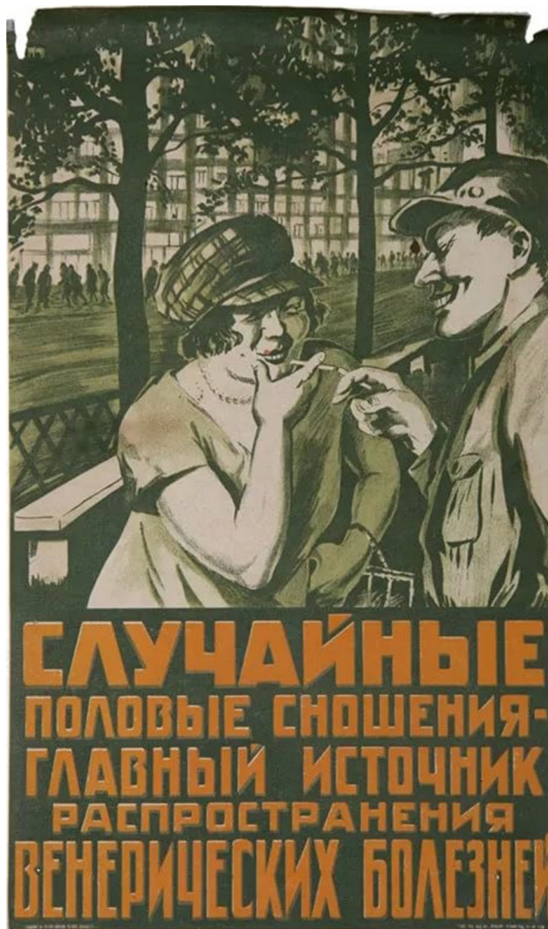
Фото 3. Плакат периода СССР