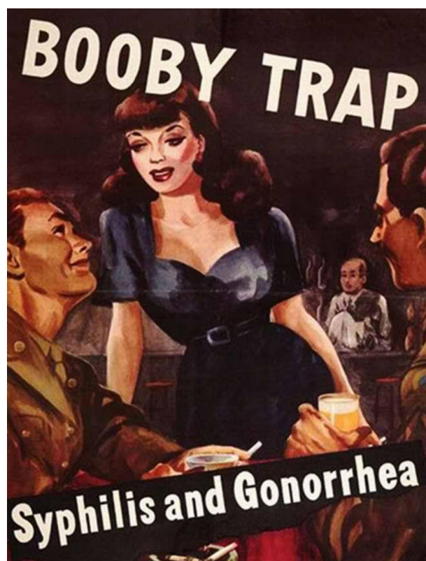
Фото 5. Американский плакат «Секс-ловушка: сифилис и гонорея»

В Испании в 1900 г. каталонский живописец Рамон Касас выполнил по заказу доктора Абреу плакат, демонстрирующий санаторий для сифилитиков в Калье Майор в Барселоне. Плакат гарантирует «полное и радикальное излечение». Касас выполнил заказ с удивительным мастерством, использовал тонкие и выразительные элементы: например, буква S в слове Sifilis выполнена в форме змеи, она намекает на опасность и внезапность болезни. S дублируется настоящей змеей в правой руке женщины, которую та держит за спиной. Женщина, изображенная на самой картине, бледна и неесте-