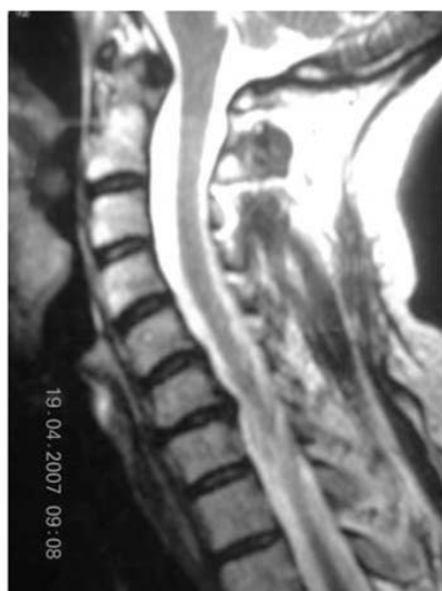
Рис. 2. ЯМР-томография шейного отдела позвоночника

а – прямая проекция; б – боковая проекция. Стрелками показан поражённый уровень С6-С7