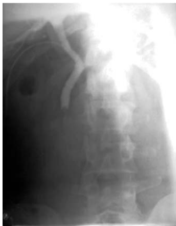
Рис.3. Результаты фистулохолангиографии: единичный конкремент в терминальном отделе холедоха, нарушение прохождения контраста в двенадцатиперстную кишку