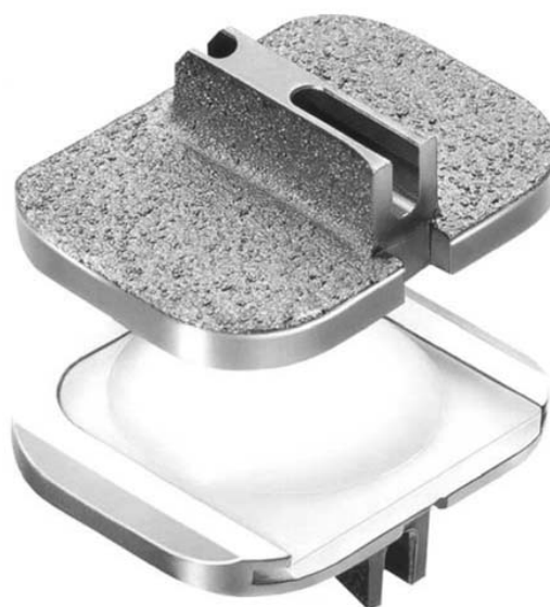
Рис. 3. Строение искусственного диска PRODISK