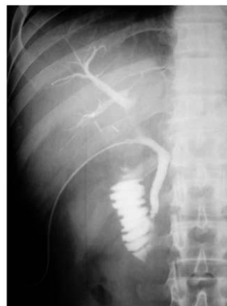
Рис.4. Результаты фистулохолангиографии на 6 сутки после лапароскопической холедохолитотомии: контраст свободно поступает в двенадцатиперстную кишку