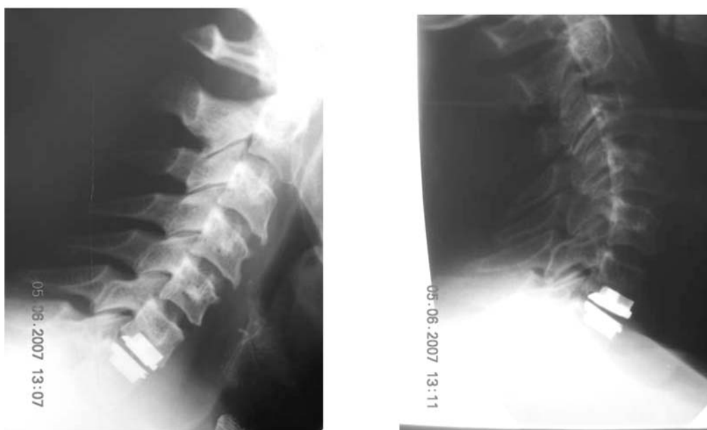
а б Рис. 5. Рентгенограммы после операции (функциональные): а – flexia; б – anteflexia